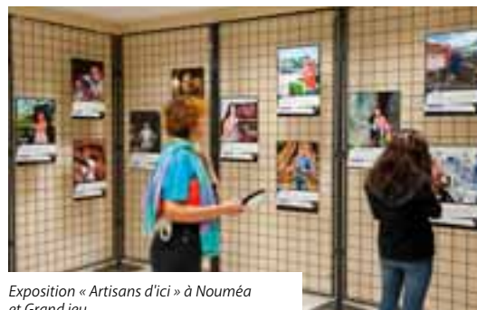
Exposition « Artisans d'ici » à Nouméa et Grand jeu