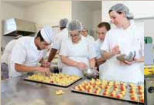
Découverte des ateliers et plateaux techniques