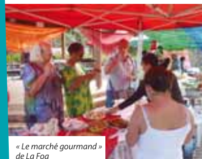
« Le marché gourmand » de La Foa