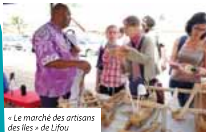
« Le marché des artisans des îles » de Lifou

Le grand public a largement répondu présent au rendez-vous avec environ 5 000 visiteurs sur l'ensemble des animations.