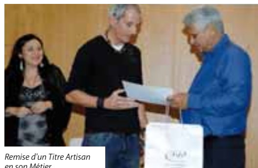
Remise d'un Titre Artisan en son Métier