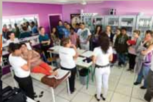
Portes-ouvertes aux public et collèges pour rencontrer les formateurs et apprentis

Imm le Fuji - 15 rue Bichet - 98800 Nouméa CPI 587 016 Trésor public