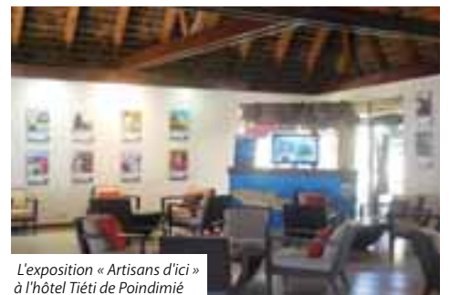
L'exposition « Artisans d'ici » à l'hôtel Tiéti de Poindimié