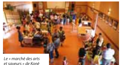
Le « marché des arts et saveurs » de Koné