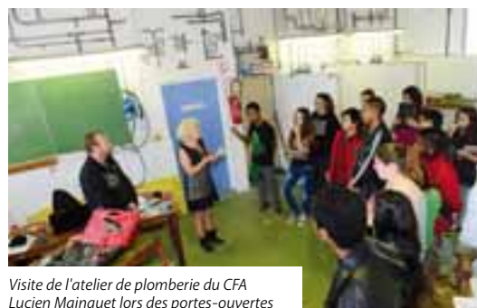
Visite de l'atelier de plomberie du CFA Lucien Mainguet lors des portes-ouvertes