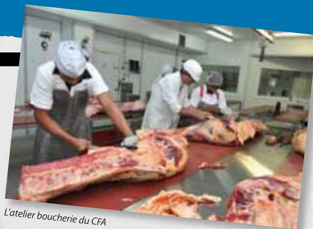
L'atelier boucherie du CFA

Le CFA Lucien Mainguet noue des partenariats afin de permettre à ses apprentis d'adapter leurs formations aux évolutions techniques du moment, ou bien de tester leurs connaissances, dans « les conditions du réel », lors d'animations extérieures ou d'événements particuliers. Aussi, plusieurs temps forts rythment l'année comme la journée portes ouvertes, les Lauréats de l'apprentissage ou, tous les deux ans, la Semaine de l'artisanat.