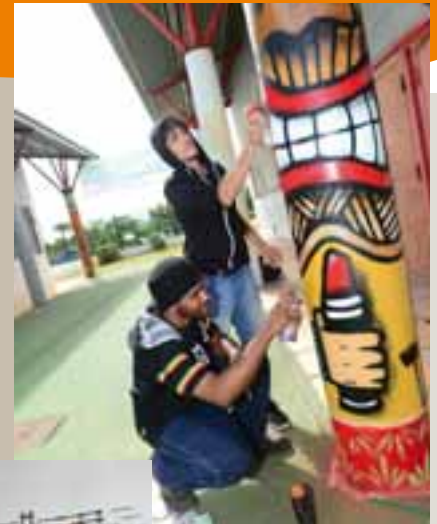
« Atelier graffs sur 20 piliers du CFA », encadré par un graffeur professionnel

En 2013, le Centre de Formation Lucien Mainguet célèbre ses 20 ans ! Le CFA était à la fête tout au long de la Semaine de l'artisanat.