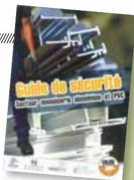
Ce guide de sécurité vous informe officiellement sur les risques encourus et les dispositions à prendre

Le secteur de la fabrication de menuiseries aluminium est qualifié d'accidentogène, c'est pour cette raison que la Direction du Travail et de l'Emploi (DTE) a réalisé une étude sur les risques professionnels dans ce secteur auprès de 20 entreprises, regroupant 303 salariés. Les risques inhérents à cette activité sont essentiellement liés au port de charges, aux postures, au bruit et à la pression de travail. Si l'esprit de sécurité n'est pas encore généralisé dans ce secteur (du fait d'un manque d'outils de management et de chiffres, et d'un turn-over soutenu notamment), de nombreuses actions de prévention/protection ont déjà été mises en œuvre et doivent être étendues et pérennisées : port d'équipements de protection individuelle, désignation d'un référent « sécurité » ou HSE (Hygiène Sécurité Environnement), évaluation des risques professionnels ou EvRP. Une mise à jour de l'étude est programmée d'ici fin 2014.