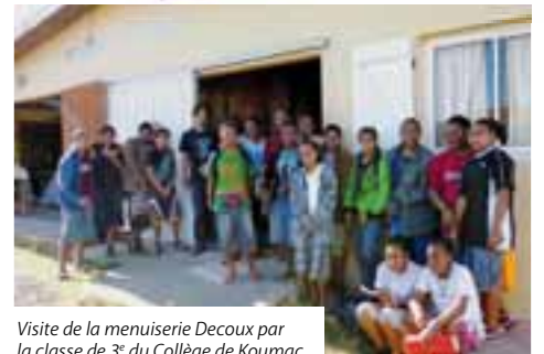
Visite de la menuiserie Decoux par la classe de 3 e du Collège de Koumac