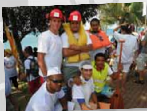
L'équipe du CFA pour la Régate des Touques 2012

La CMA était partenaire de l'émission culinaire qui a été diffusée en fin d'année dernière sur NC 1ère. Les épreuves se sont déroulées dans l'atelier cuisine du Centre de Formation Lucien Mainguet. Lors du tournage, deux apprentis ont participé comme commis et un formateur de la section cuisine faisait partie du jury.