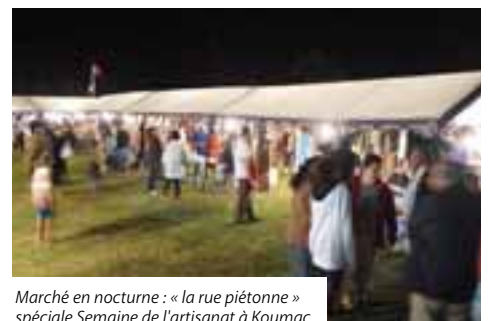
Marché en nocturne : « la rue piétonne » spéciale Semaine de l'artisanat à Koumac