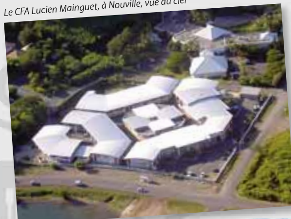
Le CFA Lucien Mainguet, à Nouville, vue du ciel

L'apprentissage est une formation par alternance qui permet à un jeune (âgé de 16 à 25 ans) d'apprendre un métier. Concrètement, chaque mois, l'apprenti passe une semaine au Centre de Formation Lucien Mainguet et trois semaines en entreprise, sur le terrain. Durant sa semaine au CFA, l'apprenti suit des cours théoriques et pratiques en lien avec son activité et prépare un diplôme reconnu. Le reste du temps, il travaille au sein de l'entreprise, sous la responsabilité d'un Maître d'apprentissage avec lequel il a signé un contrat, engagement tripartite entre l'entreprise, l'apprenti et le Centre