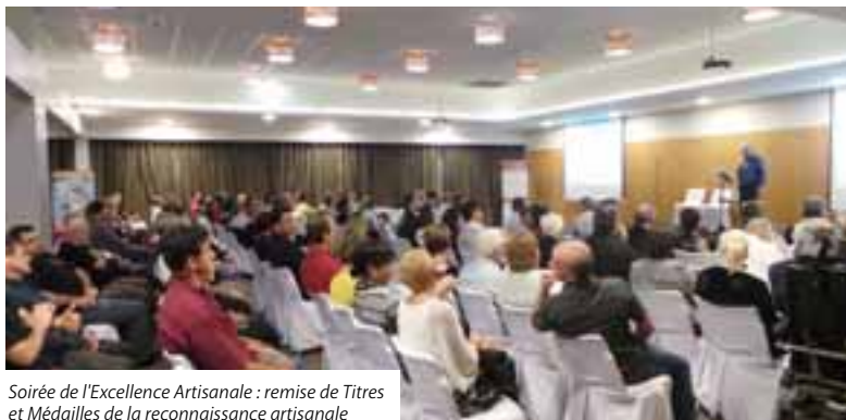
Soirée de l'Excellence Artisanale : remise de Titres et Médailles de la reconnaissance artisanale