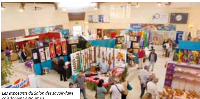
Les exposants du Salon des savoir-faire calédoniens à Nouméa