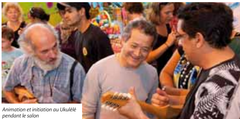
Animation et initiation au Ukulélé pendant le salon