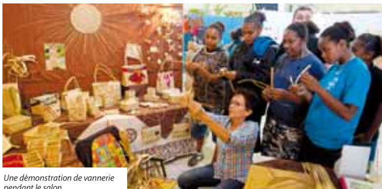
Une démonstration de vannerie pendant le salon