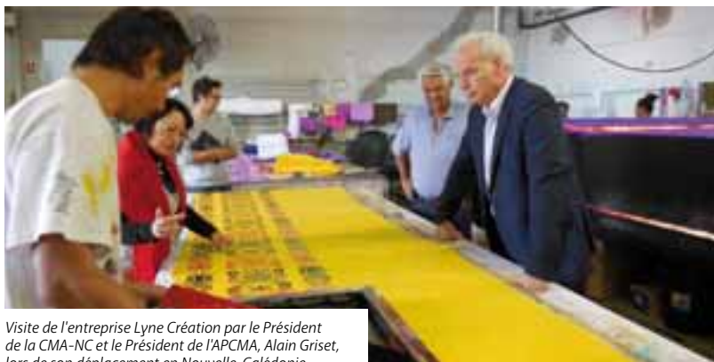
Visite de l'entreprise Lyne Création par le Président de la CMA-NC et le Président de l'APCMA, Alain Griset, lors de son déplacement en Nouvelle-Calédonie

//////////////////////////////////// Pour sa deuxième édition, la Semaine de l'artisanat a connu un franc succès ! Avec des animations dans les trois Provinces sous la forme de salon, marchés ou encore portes ouvertes en entreprises, les calédoniens ont pu entrer au cœur même de l'artisanat, première entreprise de Nouvelle-Calédonie.