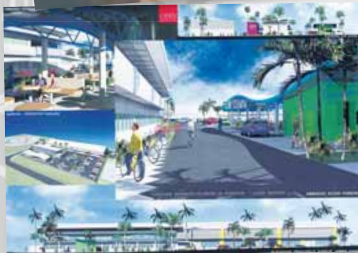
Le projet d'extension du CFA par le cabinet Cayrol

de Formation. Le contrat d'apprentissage est un contrat de travail de 2 ou 3 ans, avec 2 mois d'essai. L'apprenti accueilli au sein de l'entreprise a les mêmes droits qu'un salarié classique (congés payés, avantages divers).