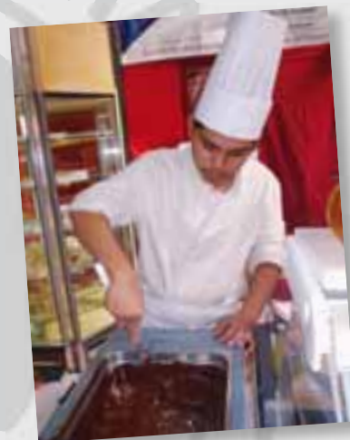
Apprenti pâtissier au Salon de la gastronomie

Un nouveau plateau technique a été mis en place en 2009 pour la section boucherie. Nos partenaires, CALEDOVIA, SODEVIA et L'OCEF, fournissent des carcasses au CFA pour des découpes à but pédagogique. Elles sont entreposées, travaillées et stockées dans un espace adapté, avec des conditions de température et d'hygiène conformes aux normes. Elles peuvent être cassées, désossées et parées par les apprentis sous le contrôle du formateur, puis récupérées dans la journée par CALEDOVIA ou SODEVIA.